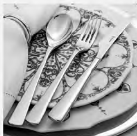
Faqueiro inox St James 77 peças