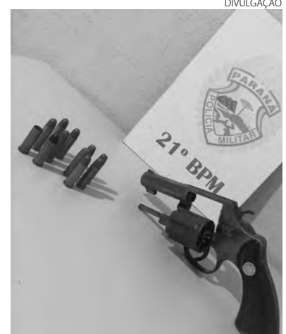
O revólver e as munições apreendidas durante a ação policial

ilegal de arma de fogo e ameaças. Ele foi entregue, juntamente com o revólver as munições, na Delegacia da Polícia Civil para as providências cabíveis ao fato. (AB)