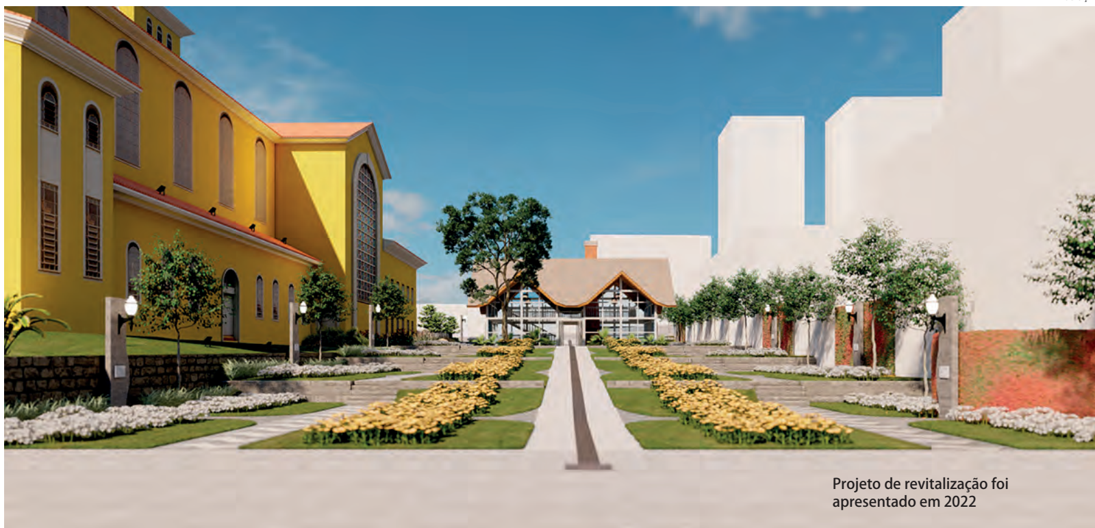
Projeto de revitalização foi apresentado em 2022