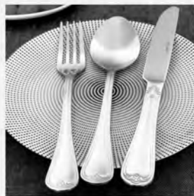
Faqueiro inox St James 48 peças