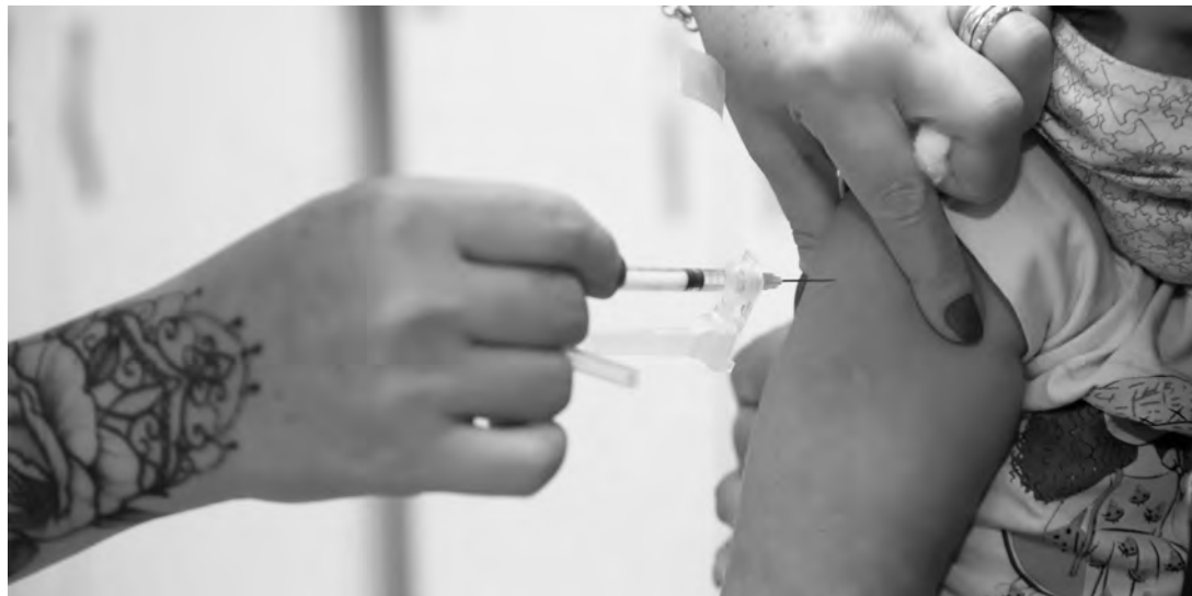
Intervalo entre as doses deve ser de quatro meses