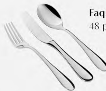
Faqueiro inox St James 48 peças