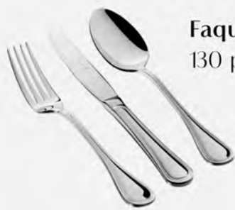
Faqueiro inox St James 130 peças