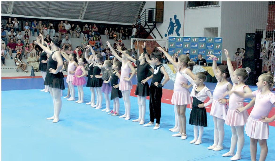
Município está ofertando oficinas para todas as idades

Então, as oficinas também elas seguem essa linha de pensamento, elas vêm para contribuir para que no final, todos tenham a