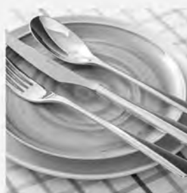
Faqueiro inox St James 101 peças