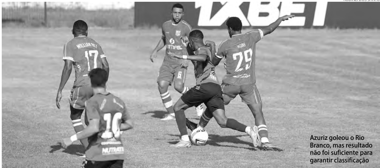
Azuriz goleou o Rio Branco, mas resultado não foi suficiente para garantir classificação