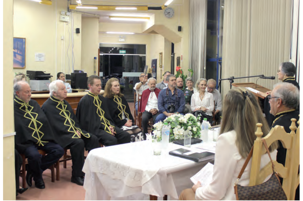
Cerimônia de posse aconteceu na última sexta-feira (24), na Biblioteca Municipal Professa Helena Braun

Luiz Felipe Panozzo luiz@diariosudoeste.com.br