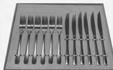
Faqueiro inox para churrasco 12 peças