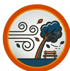
RAJADAS DE VENTO