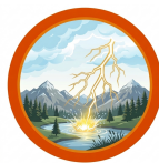
DESCARGAS ELÉTRICAS ATMOSFÉRICAS